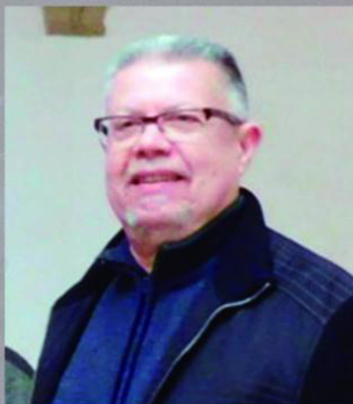
Pepe Ferrer Creación y dirección