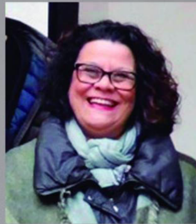
Geli Peñalver Creación y dirección