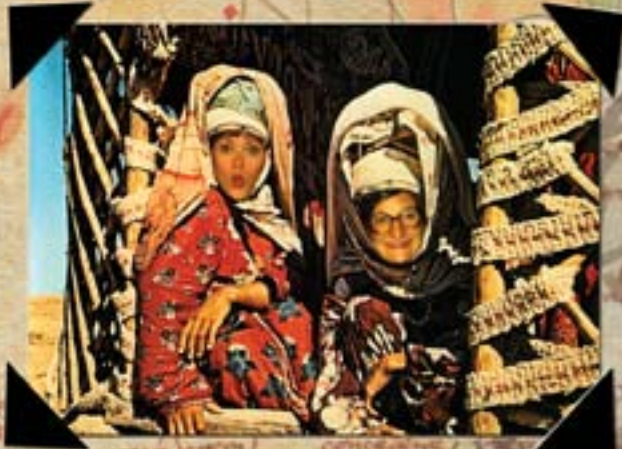
ENCUENTRO DE DOS MUJERES TURCOMANAS EN LA CIUDAD DE SAMARKANDA