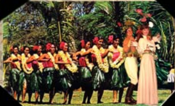
BAILANDO HULA HONOLULU