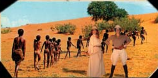
CON LOS BOSKIMANOS EN EL DESIERTO DEL KALAHARI