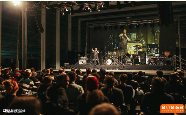
Instante de la actuación de Ray Luzier en la edición del 2017