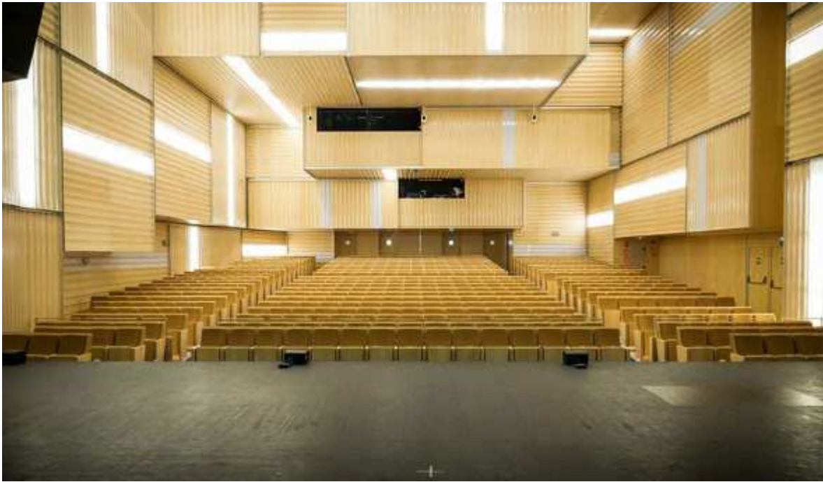
Vista desde el escenario del teatro Ramos Carrión de Zamora.

En esta nueva edición del Alteisa Drumfest 2018, se ha optado por una nueva ubicación con mejores y más modernas instalaciones, es por ello, que la celebración del evento se realizará en el nuevo teatro Ramos Carrión, ubicado en el centro de la ciudad de Zamora. La elección de este emplazamiento, se debe a que dicho teatro, fue inaugurado en 2013 y cuenta con un total de 600 butacas, un escenario de 20 metros de boca y está dotado con la última tecnología en sonido, iluminación y video. Todas las baterías estarán por ello habilitadas con un set completo de microfonía e iluminación, necesarios para que el festival cuente con un gran espectáculo.