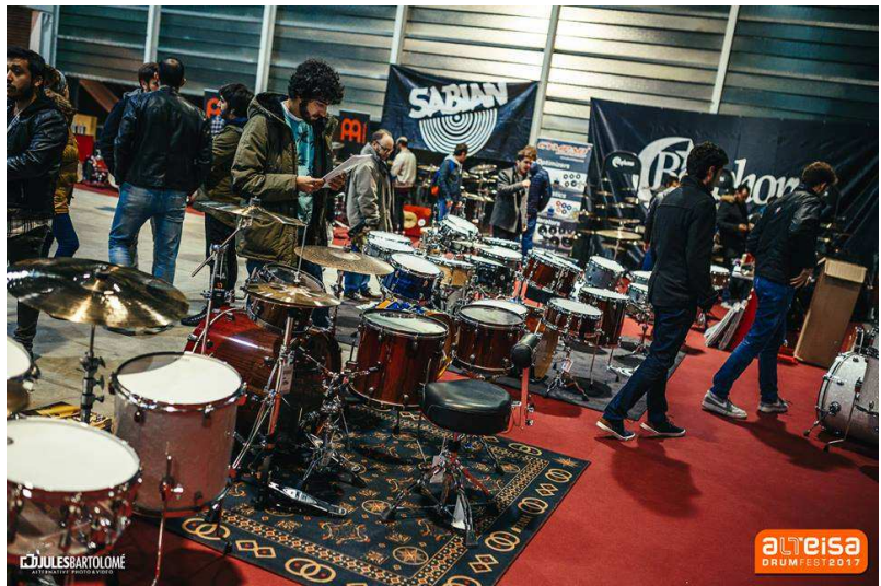
Exposición de instrumentos edición del 2017

España donde las grandes marcas que prestan su apoyo a este evento, mostrarán sus productos y los nuevos accesorios que ofertan. Entre estas grandes compañías del sector musical, debemos señalar el apoyo y la participación en el festival de Sonor, Meinl, Yamaha, Tama, Dw, Sabian, Gretsch, Wincent y Bosphorus.