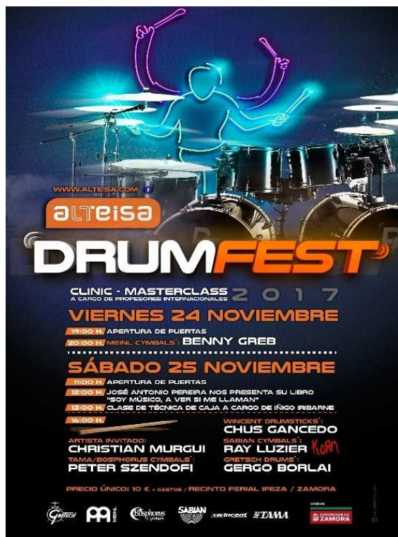
Cartel de la edición 2017

Alteisa Drum Festival nace en 2017 de la mano de un grupo de amantes de la batería y la percusión, ante la necesidad de crear un gran evento que permitiese reunir y poner en contacto a los baterías del norte de España, debido a la inexistencia de ningún evento de similares características en el entorno más próximo.