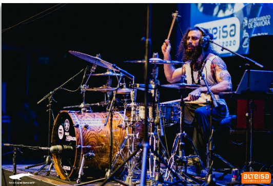
Imagen 8 - El Estepario Siberiano, edición 2020