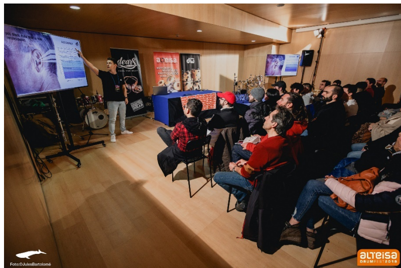
Imagen 11 - Seminario de salud auditiva, edición 2019