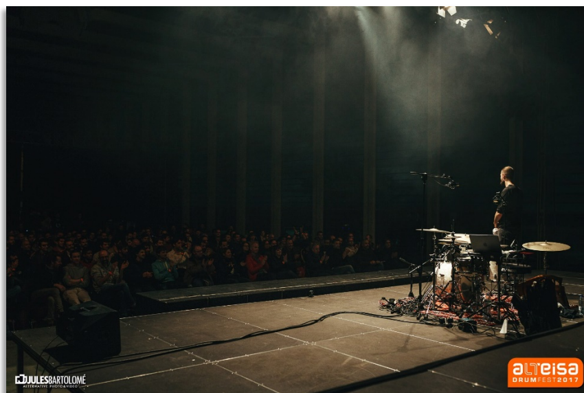
Imagen 1 - Benny Greb, edición 2017

El evento se celebrará nuevamente en el Teatro Ramos Carrión, que cuenta con capacidad para 570 personas, aunque actualmente el aforo se encuentra reducido a 400 espectadores de forma presencial. Además, las actuaciones de los artistas que lo autoricen se retransmitirán a través de Youtube