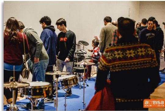
Imagen 3 - Exposición de instrumentos, edición 2018