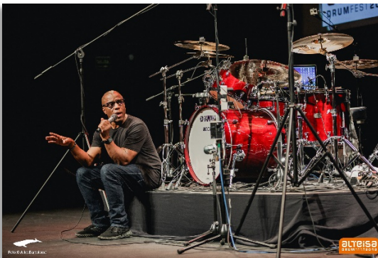
Imagen 6 - Derrick McKenzie (Jamiroquai), ed. 2019