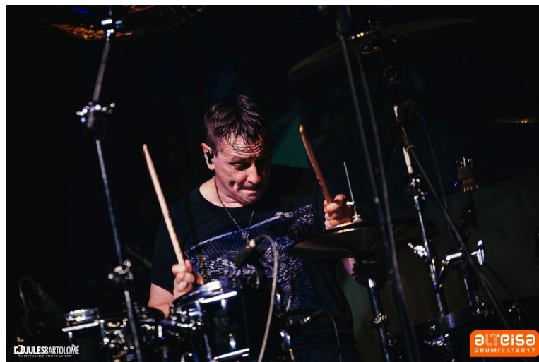
Imagen 10 - Ray Luzier (KoRn), edición 2017

Alteisa Drumfest nace en 2017 de la mano de un grupo de amantes de la batería y la percusión, ante la necesidad de crear un gran evento que permitiese reunir y poner en contacto a las baterías de la mitad norte de España, debido a la inexistencia de ningún evento de similares características en el entorno geográfico más próximo.