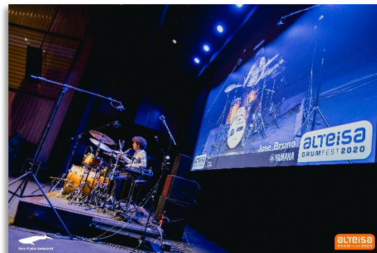
Imagen 9 - Jose Bruno (Fito y Fitipaldis), edición 2020