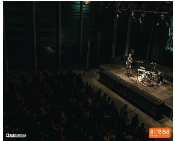
Instantánea de la actuación de Benny Greb en 2017