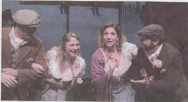
Una imagen del espectáculo, ambientado en los años 40 y en el que una compañía de zarzuela realiza el último ensayo antes de un gran concierto.