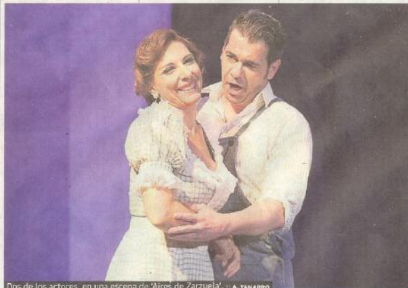
Dos de los actores, en una escena de 'Aires de Zarzuela'.

Como explican fuentes del FS, Marc Vila, Guillermo Aguilar y Xavi Lozano sufieren un concierto extravagante, con unas exquisitas composiciones musicales. Un viaje inevitablemente cómico y didáctico, con objetos cotidianos que habitualmente vemos pero no siempre escuchamos, para seguirnos demostrando que la música está allí donde decidimos encontrarla.